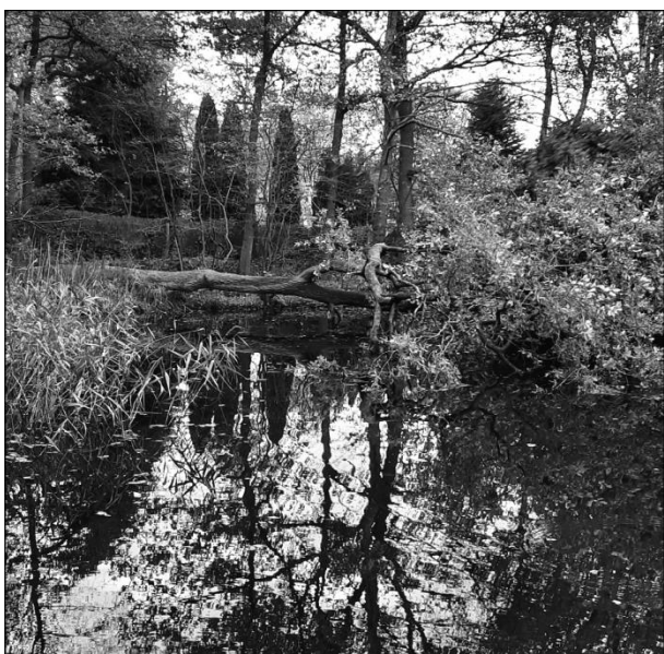
De omgevallen scheve boom

Het noodweer in de avond van zaterdag 30 oktober was teveel. Onze scheve boom, de grote eik, heeft na een 'gevecht' van jaren om maar niet te vallen, zich gewonnen gegeven. Zonder dat iemand het hoorde, viel de eik over de vijver met de kruin op het eiland.