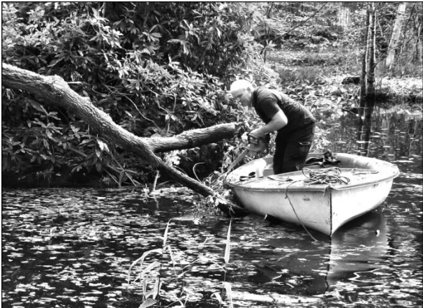
Zagen van de scheve boom in de boot

kruin is via de boot aan land gebracht en weggesleept.