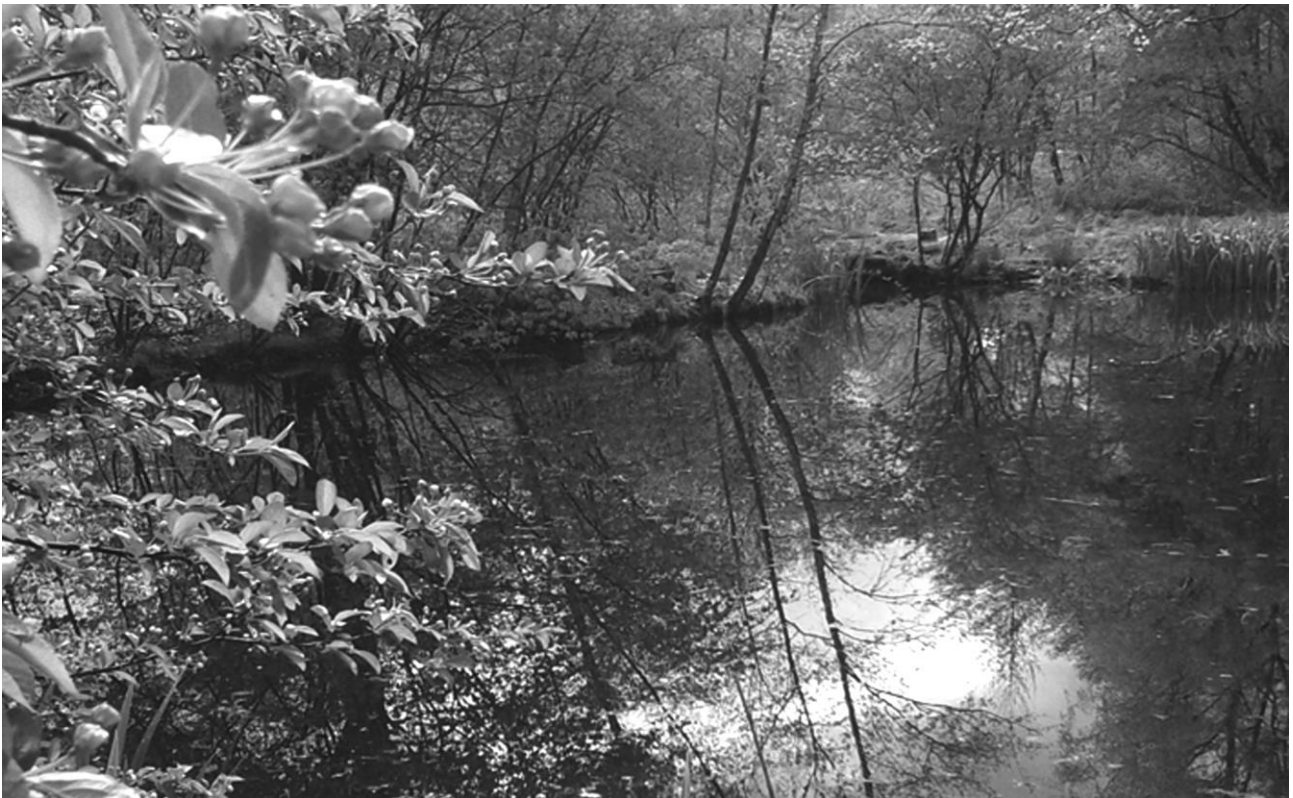
Idyllisch beeld van de tuin met bloeiende wilde kers