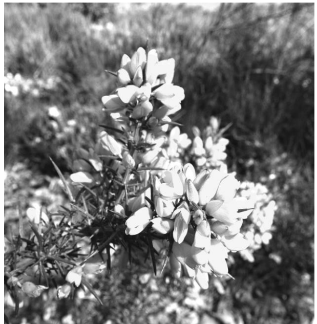
De gaspeldoorn bloeit in mei en juni

lekker buiten met elkaar aan de lange tafel! Er is een enorme lijst met klussen gedaan. Het pad langs de heidebult is vrijgemaakt,