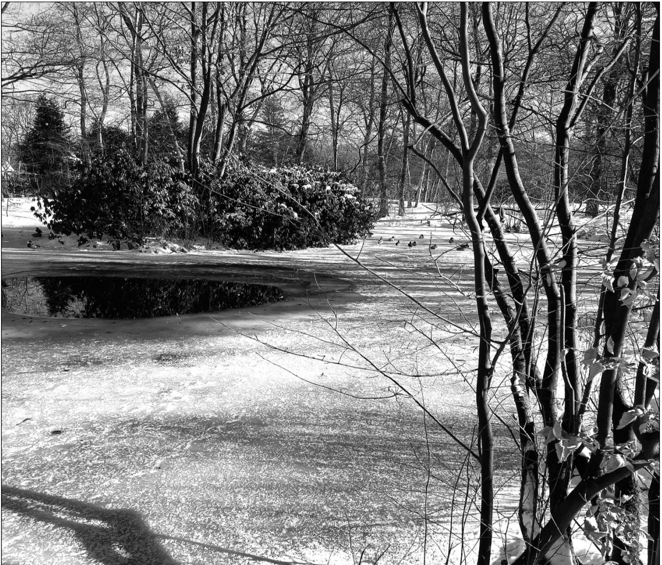
De Heimanshof in februari

Van 23 juni tot en met 14 juli, van 19 juli tot en met 13 augustus en van 17 tot en met 20 augustus waren er tuinwachten. Zij verbleven in de Hofhut, hebben de tuin in de gaten gehouden en veel bezoekers te woord gestaan.